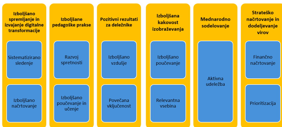
Slika 3 Primeri koristi digitalnega akcijskega načrta za institucijo poklicnega izobraževanja

Institucije poklicnega izobraževanja lahko razvijejo konkreten načrt za izboljšanje prednostnih kompetenc. Nazadnje lahko digitalni akcijski načrt prispeva tudi k finančnemu načrtovanju za nakup tehnične opreme in spremljanje lastnega napredka.